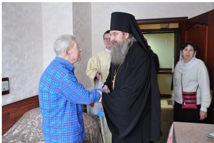
Посещение нашего пансионата Мелхиседеком на Рождество.

Того, Кто вечно был и есть, Рождает миру Дева днесь. И Непреступному Ему - Непостижимому уму Земля нашла уже приют. И в небе ангелы поют, И пастухи спешат с холма, И пред Звездой теснится тьма, А за Звездой идут волхвы. И в эту ночь познали мы, Как ради нас родиться мог Младенец - Он же вечный Бог. (В. Шидловский)